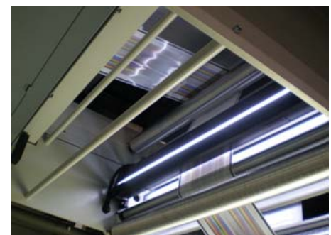
Le système EasyMax MC 2 au centre technologique DFTA